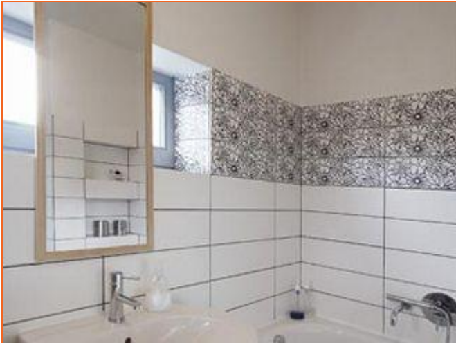
Bílý obklad doplňují tři pruhy černobílých obkladaček s květinovým dekorem

Svému účelu dobře poslouží i nábytek značky IKEA, obdařený navíc svěžím designem. "Kvalita bydlení pro nás nespočívá ve vzhledu a velikosti domu, ale spíše ve funkčnosti, stylu a dobrých nápadech," říká paní domu.