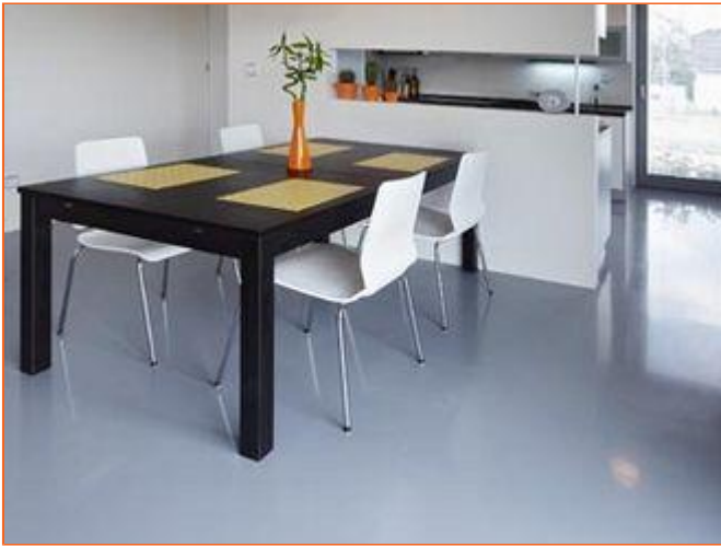
Bílé židle z překližky příjemně kontrastují s tmavou deskou stolu

Důkladným testem na misce vah prošel i výběr nábytku a zařízení. "Podle mého názoru kvalitně provedená kuchyňská linka z MDF desek splní stejnou službu a navíc se mnohem lépe udržuje než kuchyň dýhovaná."