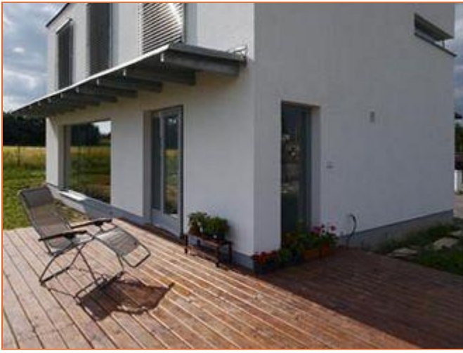
Dřevěná terasa zvětšuje obytný prostor zejména v létě